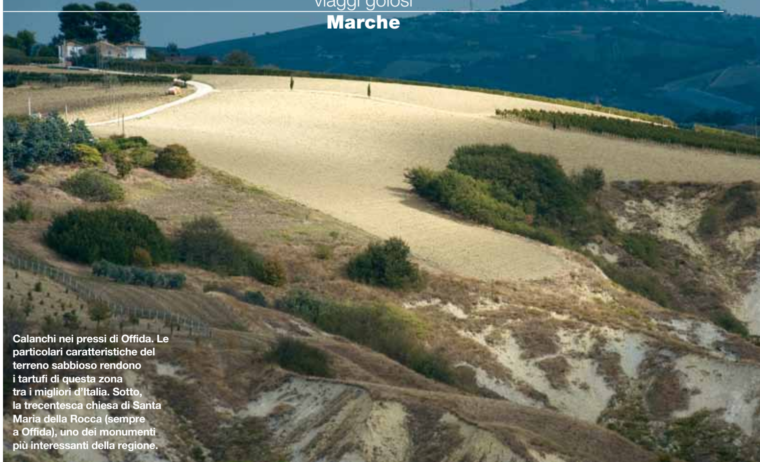
Calanchi nei pressi di Offida. Le particolari caratteristiche del terreno sabbioso rendono i tartufi di questa zona tra i migliori d'Italia. Sotto, la trecentesca chiesa di Santa Maria della Rocca (sempre a Offida), uno dei monumenti più interessanti della regione.

prodotti di questa terra dove per secoli, forse, non ci è resi conto di possedere un patrimonio grande. Mai sperperato o svenduto. Anche se qualcuno dice neppure mai fatto conoscere come merita.